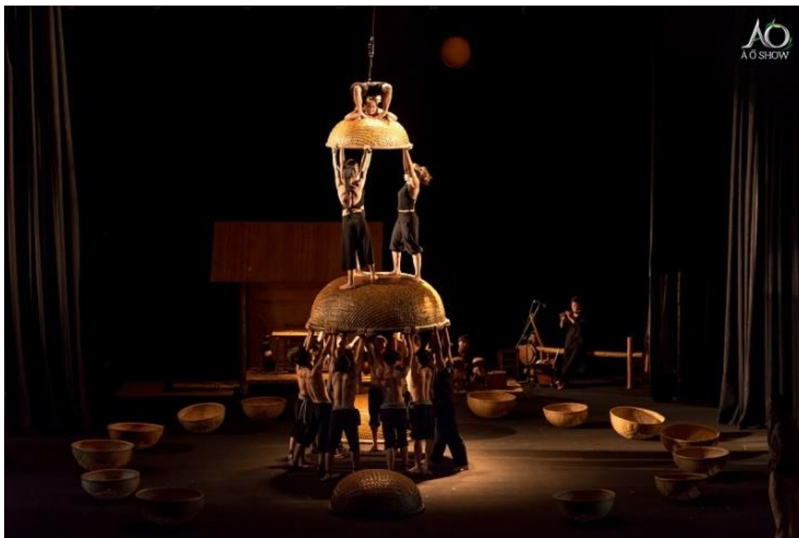
Figura 1 - Foto do espetáculo “A O Lang Pho – O Vilarejo e A Cidade”, do Vietnã, que abre a quarta edição do CIRCOS de 2017 e une acrobacias, manipulação de bambus, dança contemporânea e música ao vivo

A quarta edição do CIRCOS – Festival Internacional Sesc de Circo contará com 31 ações artísticas, de 14 diferentes países além do Brasil, em 13 unidades; ingressos começam a ser vendidos a partir de 24 de maio